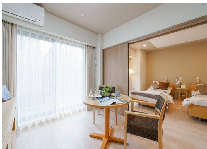
【チャームプレミア 柿の木坂 居室】