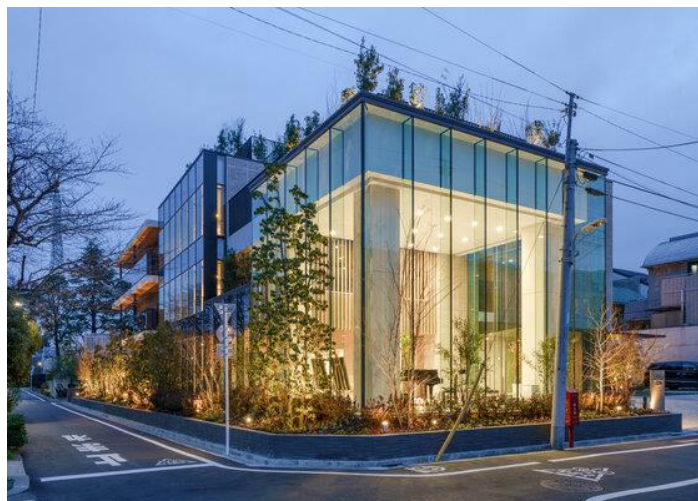
【チャームプレミア 柿の木坂 外観】